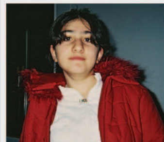
Bisian fotograferet i deportationscenter Avnstrup 2005